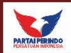
PARTAI PERSATUAN INDONESIA