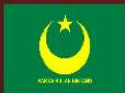
PARTAI BULAN BINTANG