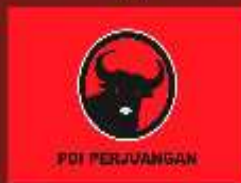
PARTAI DEMOKRASI INDONESIA PERJUANGAN