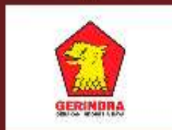
PARTAI GERAKAN INDONESIA RAYA