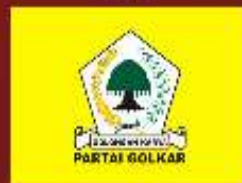
PARTAI GOLONGAN KARYA