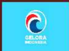
PARTAI GELOMBANG RAKYAT INDONESIA