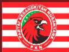
PARTAI KEBANGKITAN NUSANTARA