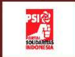
PARTAI SOLIDARITAS INDONESIA