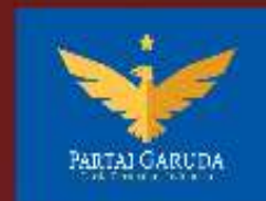
PARTAI GARUDA PERUBAHAN INDONESIA