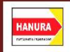
PARTAI HATI NURANI RAKYAT